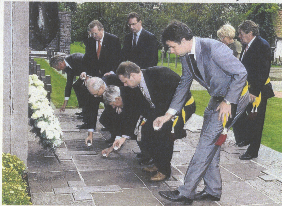
Europees president Herman Van Rompuy, minister van Defensie Pieter De Crem en andere prominenten plaatsten kaarsjes aan het monument van de slachtoffers in Vinkt.

Na een bloemenhulde en het plaatsen van kaarsjes aan het monument van de slachtoffers nam de zoon van een Duitse soldaat die destijds betrokken was bij de oorlogsmisdaden het woord. «Mijn vader sneuvelde in 1942 in Rusland. Pas veel later ben ik de ware toedracht van wat zich hier afspeelde te weten gekomen. Het lot van de mensen van Vinkt doet mij vandaag nog veel pijn, daarom moet de herinnering aan deze tragedie bewaard blijven», sprak de man. Ook Herman Van Rompuy voelde zich duidelijk nog nauw verbonden met de bevolking van Vinkt. Na de plechtigheid nam hij ruim de tijd om te praten met nabestaanden van de slachtoffers van mei '40.