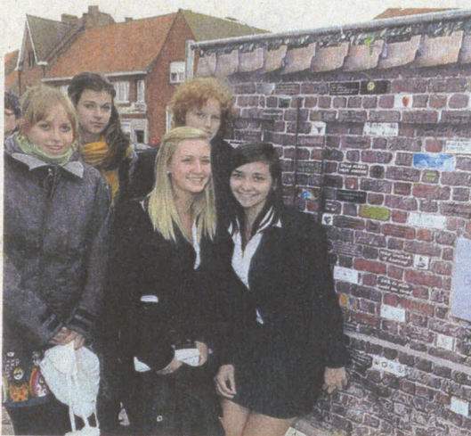
Enkele leerlingen bij de vredesmuur waar ze een boodschap op schreven.